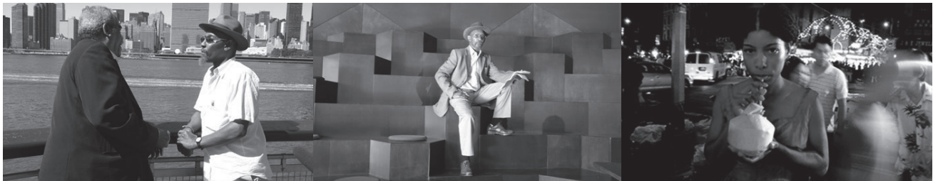
Making History, 2008